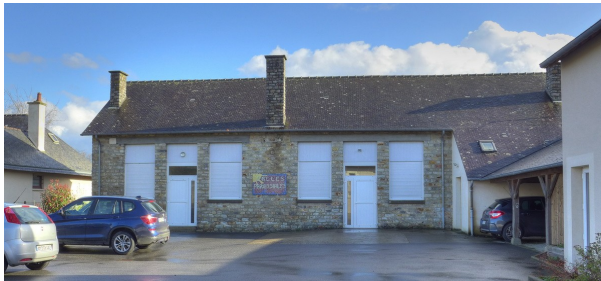
Les salles de théâtre autrefois à Acigné avec, ci-dessus, l'ancienne école privée de garçons rue Saint-Georges et, à droite, la maquette du Foyer Saint-Martin, actuel cinéma.

La séance principale s'effectuait pour la veillée de Noël à 20h 30 et avant la messe de minuit à 23h 30. Il y avait parfois des séances supplémentaires au printemps et dans quelques bourgs demandeurs. La troupe était composée de jeunes et d'adultes et l'ambiance était bonne.