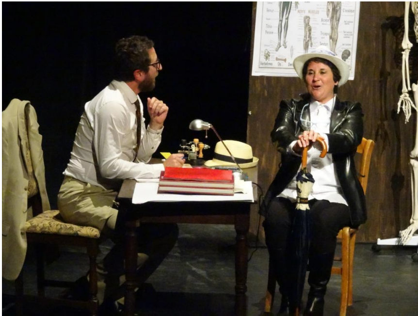
Scène du Docteur "Knock", de Jules Romain, pièce jouée en 2015 au Triptik.