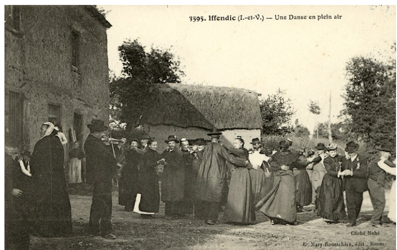
3595. Iffendic (I.-et-V.) — Une Danse en plein air

Danse en couples au son du violon à Iffendic au début du XX e siècle.