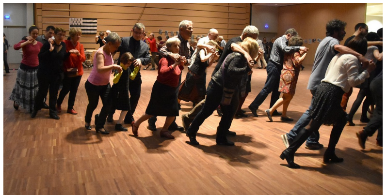
L'aéroplane lors d'un fest-noz à Acigné en 2019.

Pour voir la danse l'aéroplane, cliquez ici (vidéo de 2 mn)