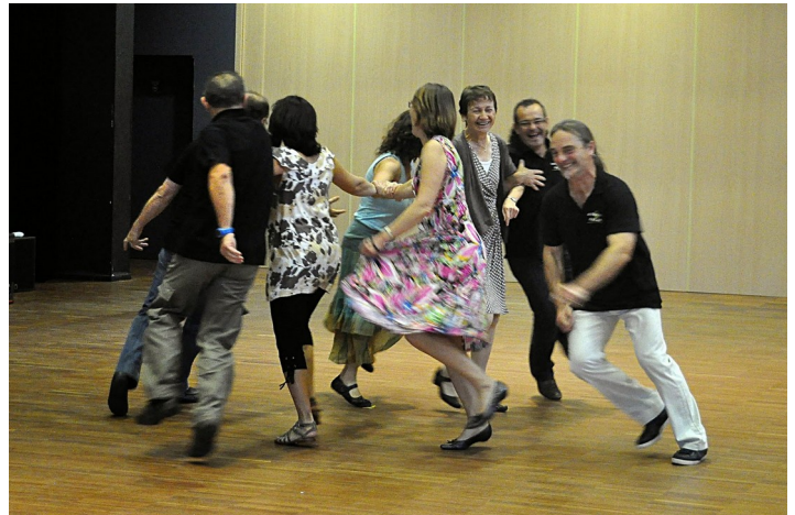
Le moulinet d'Acigné par les danseurs du Moulinet !

Pour voir la danse du moulinet d'Acigné, cliquez ici (vidéo de 2 mn)