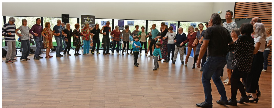
Cabaret / Fest-deiz à Acigné en octobre 2022.