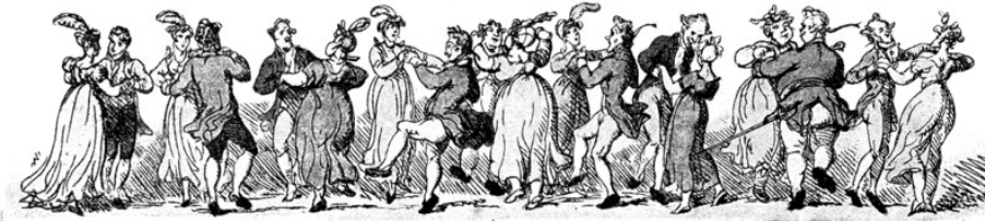
Country dance (caricature anglaise du XVIII e siècle).

Identifiées en Angleterre au XVII e siècle, sous le nom de country dance (danse de la campagne), elles se diffusèrent rapidement en France sous le nom de contredanses. Elles plurent par leur aspect joyeux.