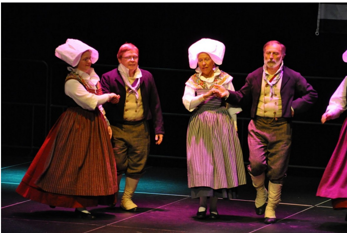
Le Groupe gallo-breton de Rennes lors de la Fête de la Bretagne au Triptik à Acigné en 2011.

La plupart de ces répertoires s'organisent avec quatre danseurs, comme l'avant-deux ou le quadrille. Offrant plus que toute autre danse des possibilités d'inventions avec des agencements de figures combinables à l'infini, de multiples variantes locales sont nées avec par exemple le moulinet d'Acigné, avec huit danseurs, une variante du sacristain, ou bien les avant deux de La Mézière, du Coglais, de Bazouges la Pérouse, etc.