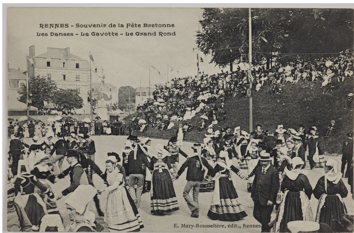
Avant les années 1970, les danses traditionnelles étaient surtout l'affaire des groupes folkloriques se produisant en public. Ici au Champ de Mars, l'actuelle place Charles de Gaulle, à Rennes en 1906.

Au fait, où se situe la frontière entre les danses traditionnelles et les danses modernes ? Marc Clérvet, auteur de l'ouvrage de référence sur le sujet en pays gallo, le situe au niveau du mode de transmission. L'apprentissage s'effectuait autrefois par immersion des plus jeunes dans le bain culturel constitué par une pratique collective multigénérationnelle. Les jeunes apprenaient le pas dès leur plus jeune âge dans le cadre familial, en donnant la main à un adulte. Le répertoire se renouvelait cependant mais pas aussi fréquemment que pour les danses modernes, même si certaines peuvent perdurer au delà d'une génération, comme la valse et le rock. On peut ajouter un autre critère, la chorégraphie de groupe habituelle pour les danses traditionnelles, de plus en plus rare pour les danses modernes. Il en ressort une ambiance assez différente car, avec les danses traditionnelles, le danseur s'intègre ordinairement dans l'organisation collective de chaînes, de figures ou de cortèges.