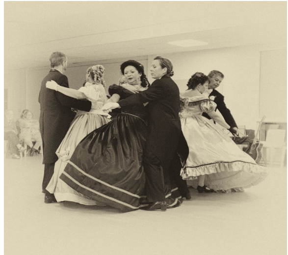
Le groupe Saison de bals effectue une démonstration de danses en couples à Acigné, comme au XIX e siècle dans les cercles aristocratiques et bourgeois.

Au XIX e siècle, les danses à figures, comme les quadrilles et les avant-deux, vont donc à leur tour être concurrencées par ces nouvelles modes de danses en couples, qui vont se décliner en maintes variantes, comme la polka piquée, l'aéroplane... Cette dernière, dont le nom évoque les ailes d'avion formées par les bras des danseurs, était très populaire d'Acigné à Saint-Péran.