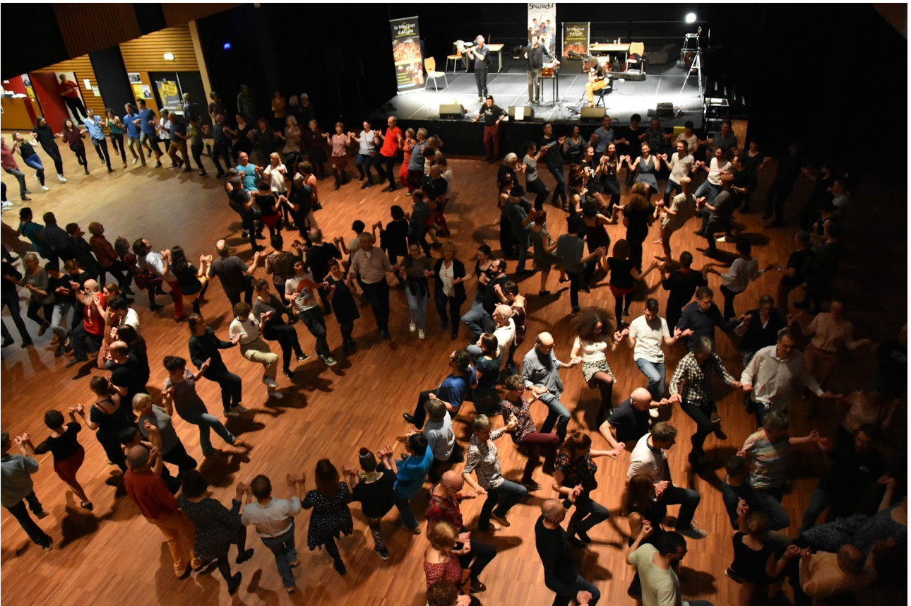
Fest-noz au Triptik à Acigné en mars 2022 dans le cadre des rencontres interculturelles SEVENADUR, organisées chaque année avec le Cercle Celtique de Rennes.

Les branles revivent cependant dans le cadre des festoù-noz à Acigné et ailleurs, où ridée, pilé-menu, passepiéd, rond de Saint-Vincent, etc, issus des franges de la Haute-Bretagne, sont pratiqués, de même que le répertoire de danses en rondes et en chaînes de Basse-Bretagne.