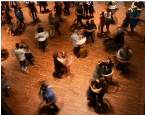
Danse en couples au Triptik.