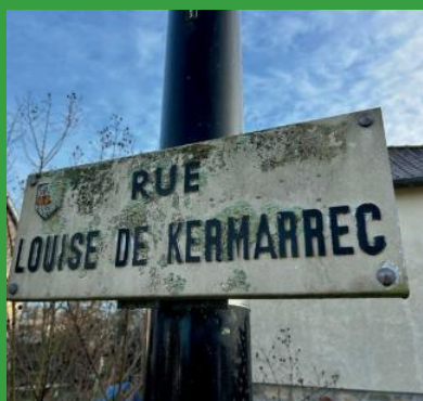
La rue "Louise de Kermarec"