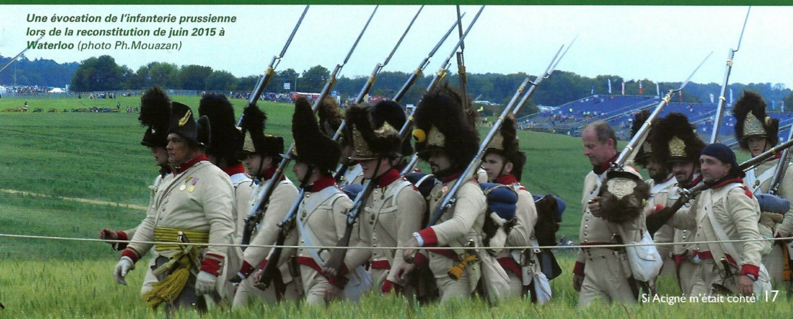
Une évocation de l'infanterie prussienne lors de la reconstitution de juin 2015 à Waterloo

En principe l'Etat remboursera avec retard les frais occasionnés aux communes par les réquisitions et devra pour ce faire emprunter aux banques ... anglaises ! Cet épisode de l'occupation prussienne chez nous en 1815 est peu connu, mais en cette année du bicentenaire de Waterloo, il était bon de l'évoquer puisque Acigné y fut mis à contribution en tant que commune agricole bien approvisionnée.