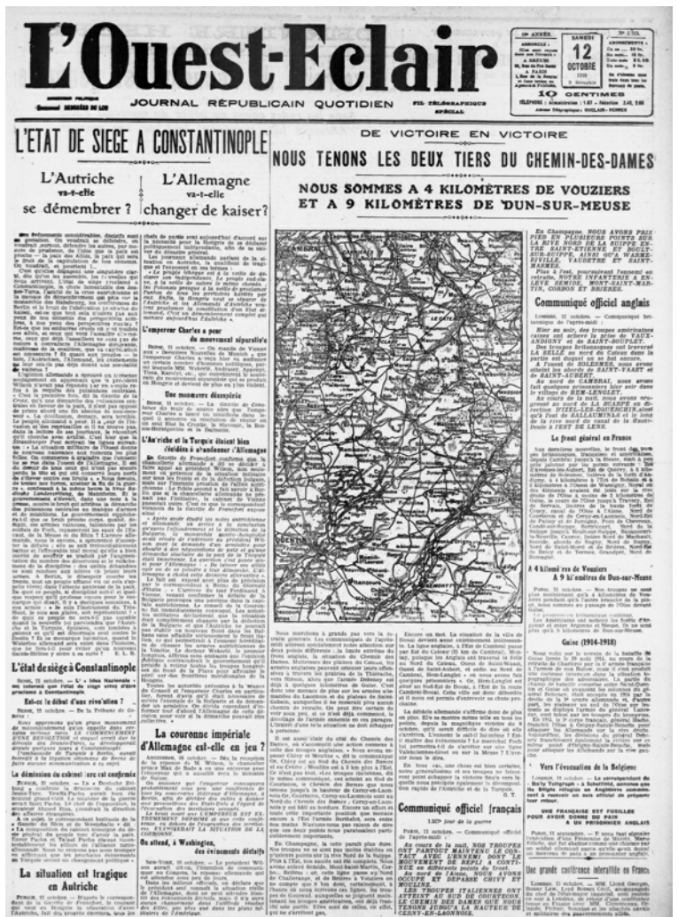
La une du journal L'Ouest-Eclair du 12 octobre 1918.

Ces deux journaux concurrents, dont les sièges sont à Rennes, font généralement quatre pages par numéro. Dans cette période cruciale de la Guerre 14-18, cette pagination est exploitée de manière similaire par les deux journaux. Approximativement la moitié est consacrée à la guerre, avec les informations sur les opérations militaires et les débats politiques en cours, quasiment totalement consacrés au conflit. En octobre 1918, on approche du dénouement et l'attention est focalisée sur les actualités du conflit, plus encore que les mois précédents. La troisième page est consacrée aux informations diverses et la dernière aux petites annonces, parsemée de multiples « réclames » (les encarts publicitaires). Les articles consacrés à la grippe espagnole, assez réguliers, sont tous en pages intérieures, dans l'espace actualités diverses. En octobre, il n'est donc jamais fait mention de cette épidémie dans la page de garde, où les titres sont toujours, sans exception, consacrés à la guerre.